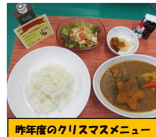
昨年度のクリスマスメニュー

当院では季節ごとのイベントに合わせて、行事食を提供させていただいております。患者さんの健康はもちろんのこと、見た目にもお楽しみいただけるように工夫しております。今年も終わりに近づいておりますが、引き続き患者さんに楽しくお食事頂ける病院食を提供してまいります。