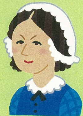
フローレンス・ナイチンゲール (1820年5月12日 - 1910年8月13日)

5月12日はフローレンス・ナイチンゲールの誕生日にちなみ、「看護の日」に制定されており、毎年5月12日を含む日曜日から土曜日は「看護週間」として各地でイベントを実施しております。